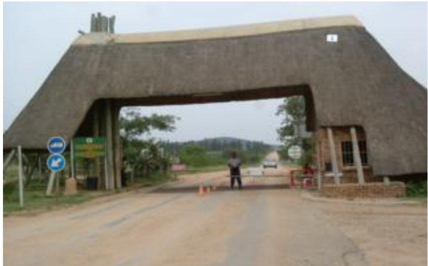
Entree Marloth Park

We zijn lekker door het park gewandeld en hebben al van alles gezien qua wild. Kudde buffels in Kruger park langs de rivier. Rooibokjes, bosbokjes, familie kudu, giraffe, vlakvarkens en zebra's in het park! Wat een rijkdom. Een tijdje een mestkever bestudeert. Dit beestje heeft een missie "ik moet die kant op dus aan de kant". Vlinders in de meest prachtige kleuren en sprinkhanen met streepjes.