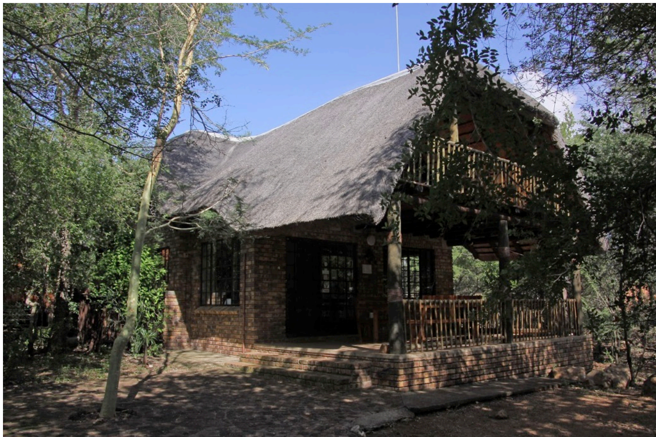
Vakantiehuis Mhofu & Marloth Park