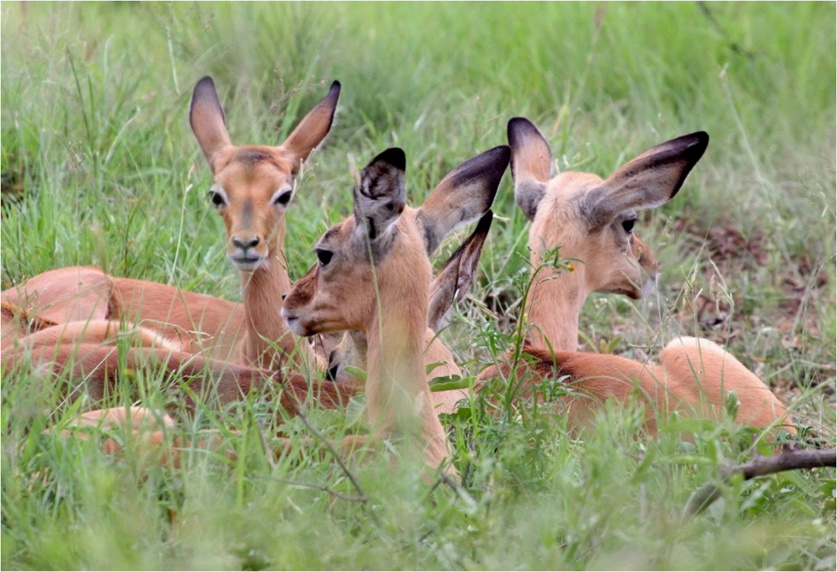
Kruger Nationaal Park Game drive met Kobus