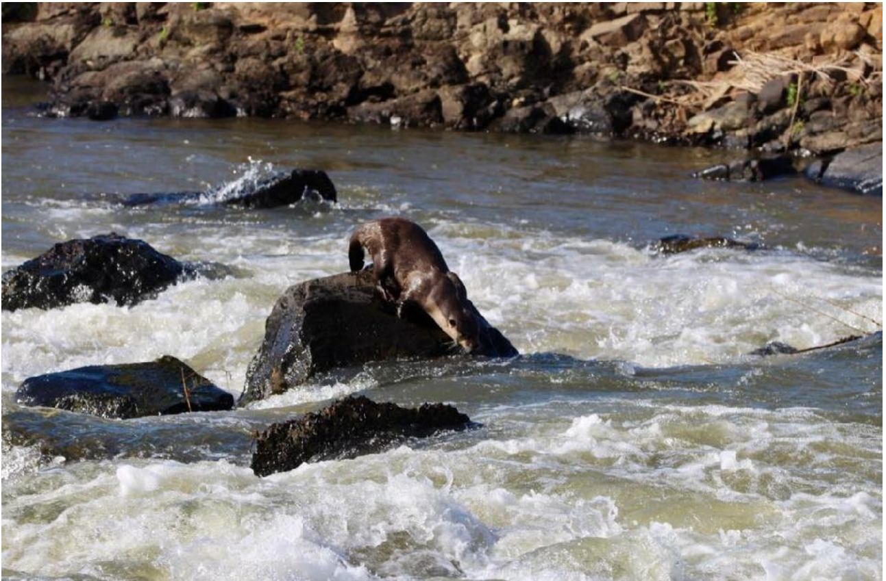
Otter @ Lower Sabie